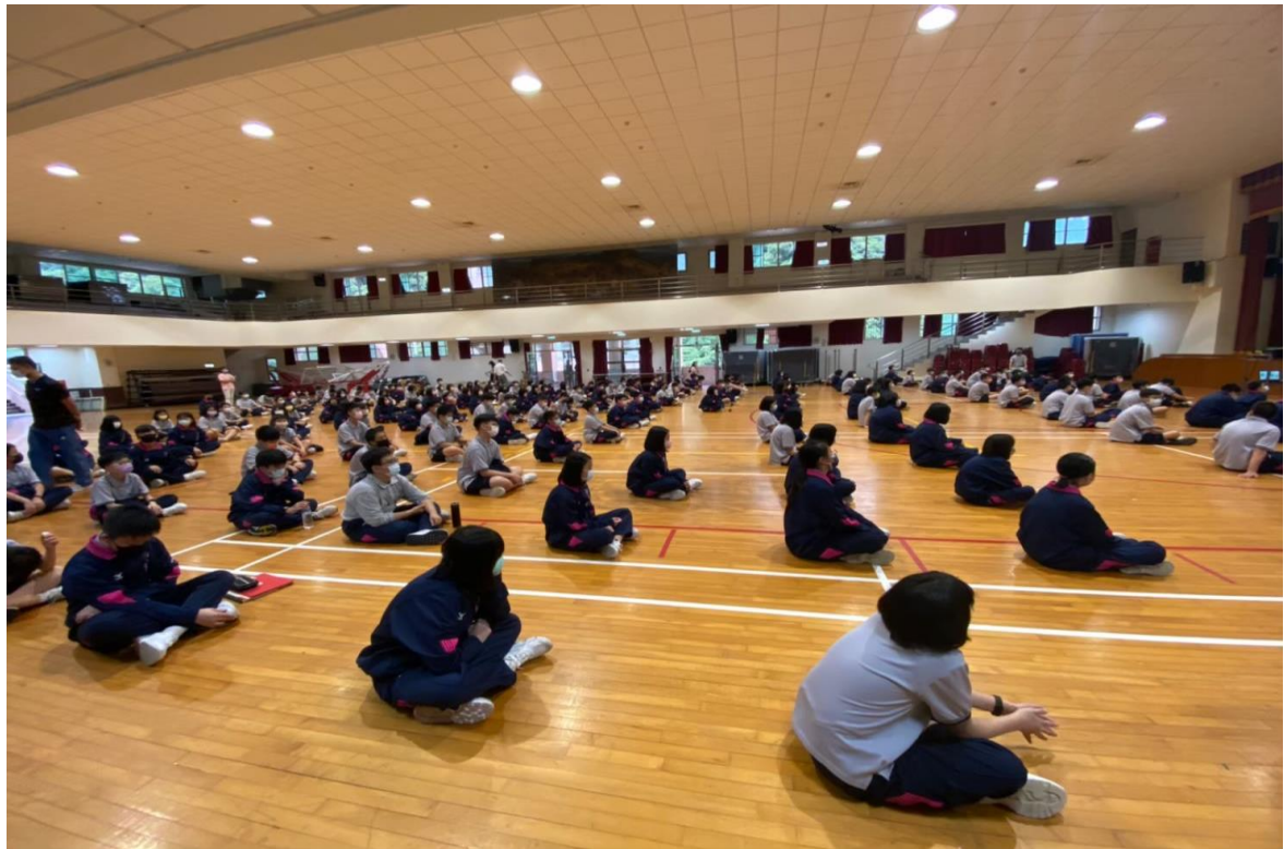
照片四說明：學生專注聆聽(遵守防疫規範)