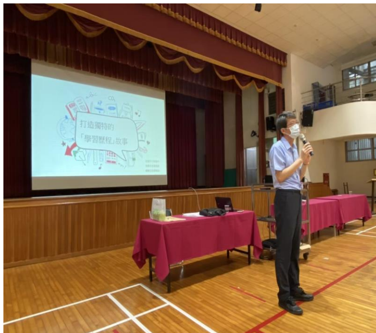
照片一說明：校長致詞