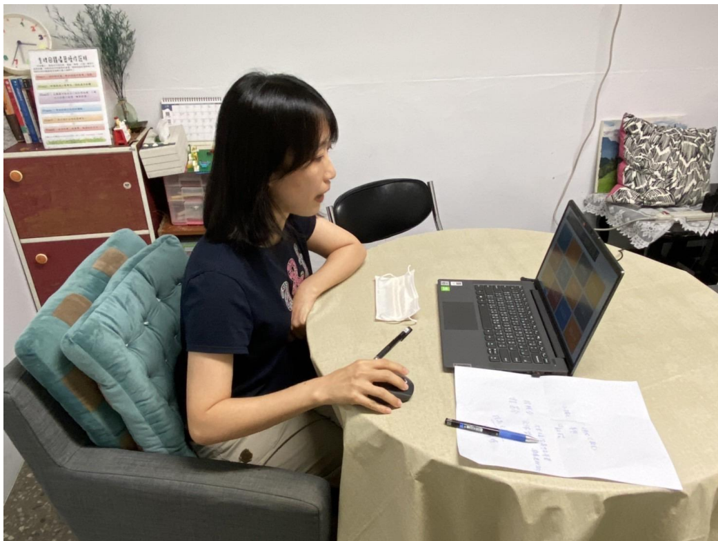
照片一說明：輔導老師於諮商室進行講座