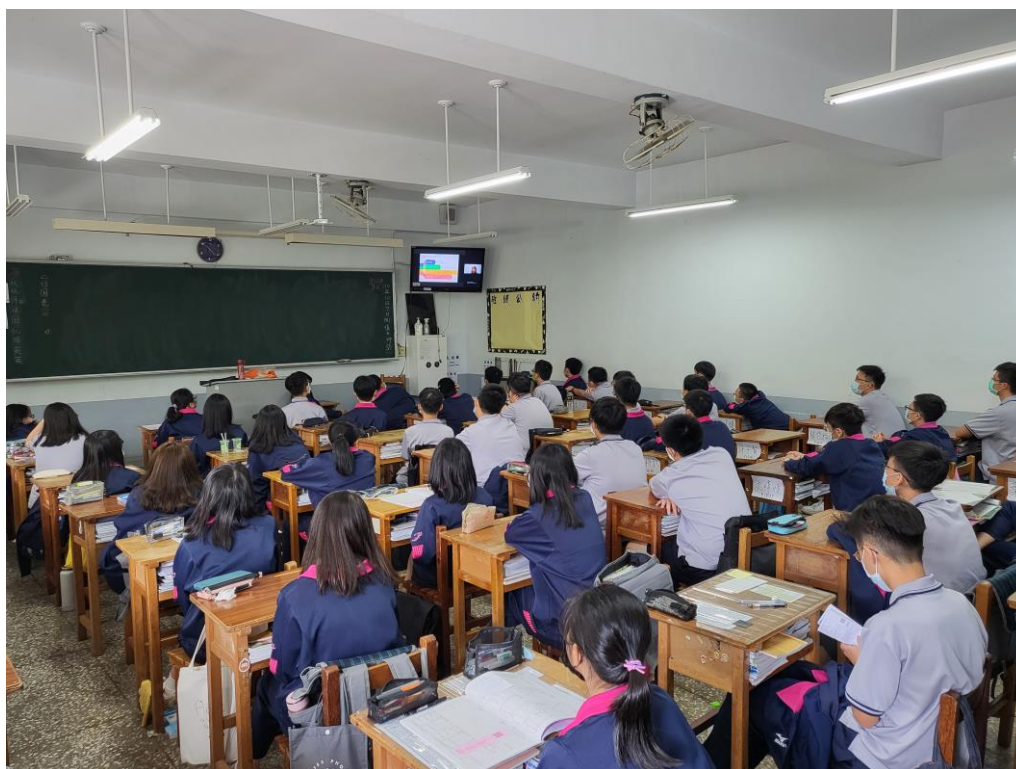
照片二說明：學生於各班教室進行聆聽