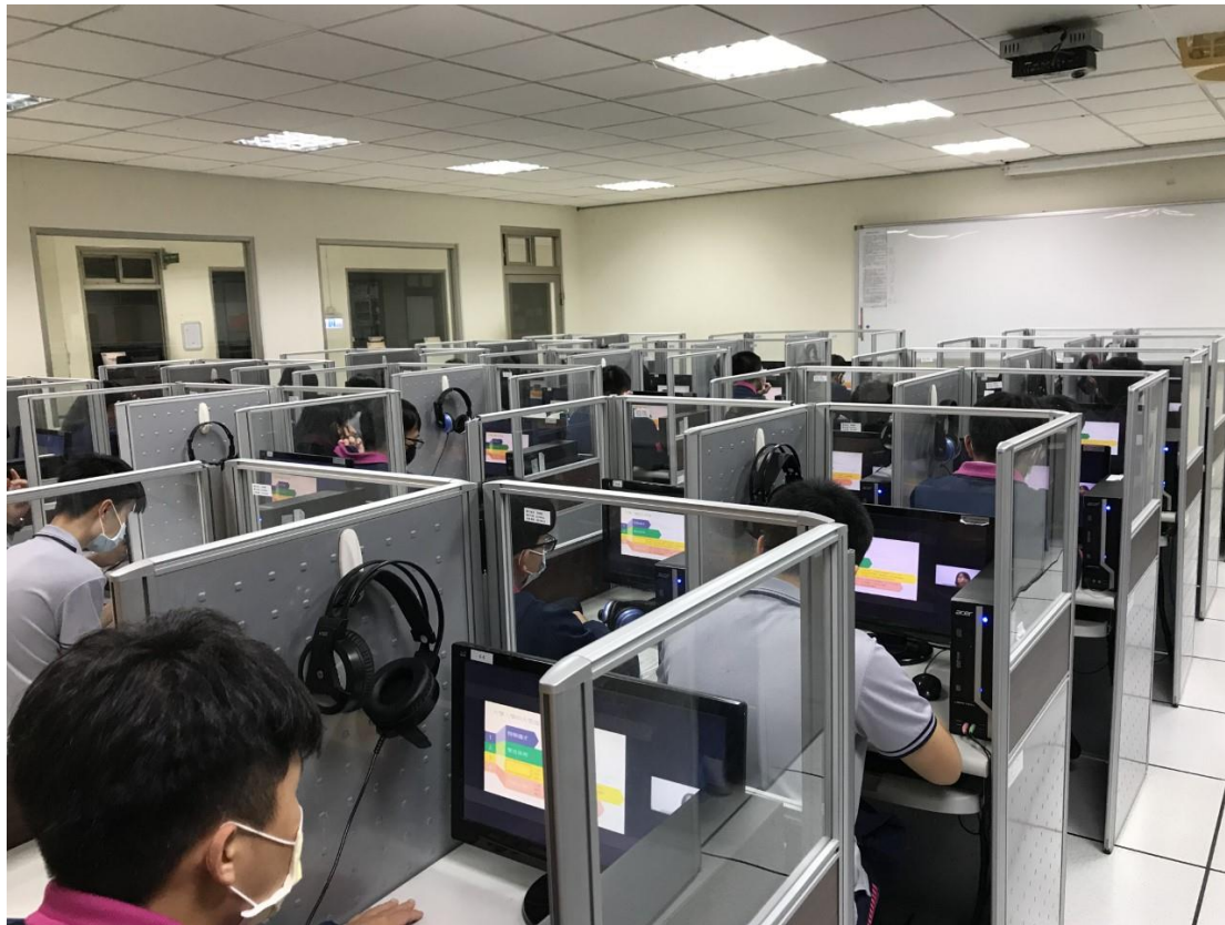
照片三說明：學生於電腦教室聆聽