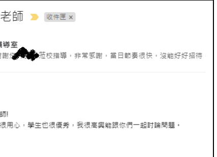
18. 王教授回饋與鼓勵