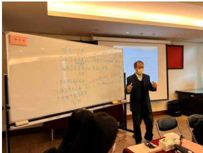
10. 思辨之旅：教授歸納與組織 1