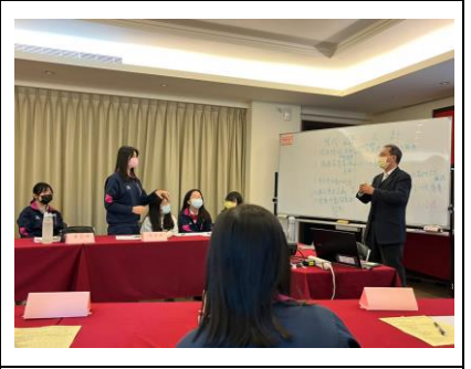
9. 思辨之旅：價值兩端思辨 4