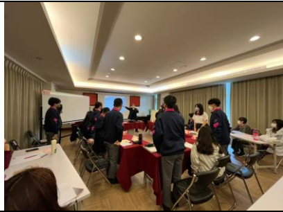
4. 思辨之源：我的思維決定--贊成 VS 反對