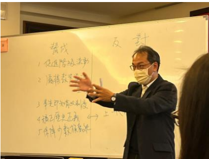
13 思辨之旅：反思練習