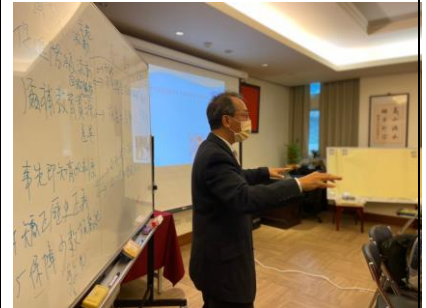
12 思辨之旅：立場提問