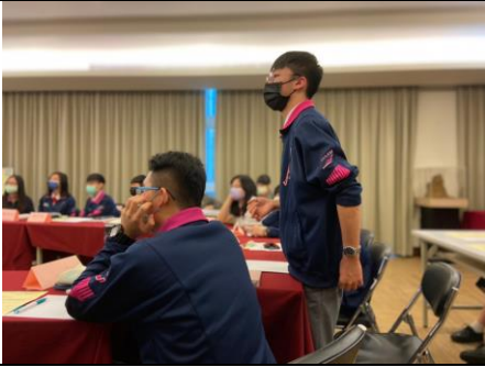
7. 思辨之旅：價值兩端思辨 2