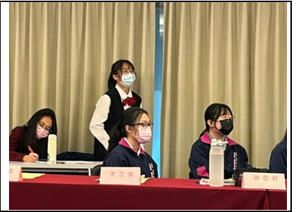
6. 思辨之旅：價值兩端思辨 1