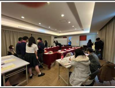
5. 思辨之旅：分組激盪思考