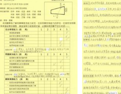
14 思辨回饋：學生反思與回饋