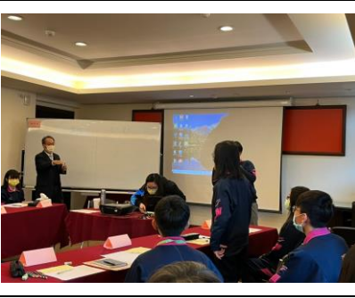
8. 思辨之旅：價值兩端思辨 3