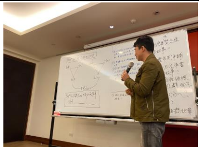
10.現象場·短講時間「我們要怎麼認識這個世界」(講師於社群教室前面)