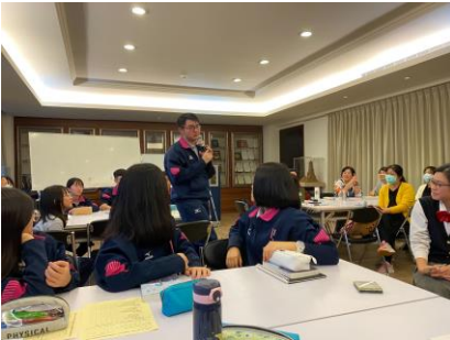
7.下半場:PBL 師生社群小組介紹(醫學與探究組)