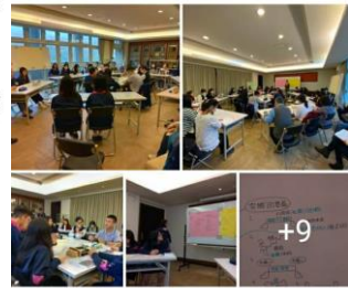
104 5則留言 · 7次分享

（註：經向活動主要規劃的敏如老師詢問，這次的「空橋專案小組」... 呃，好啦，其實這個名字是我發明的，成形的過程是：「演示的人依其意願主動爭取，2個月前發書，社團時間利用幾分鐘的時間確認進度，1個月前社長威傑及副社翔任設計問卷了解同學們對議題延伸之深度，2週前由4位指導老師選出同學。」有沒有很值得再給他們一次大大的鼓勵！👏👏👏）