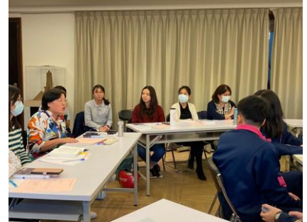
6.觀摩的外校老師回饋中(是一種敘事治療的圈外見證人的概念呢)