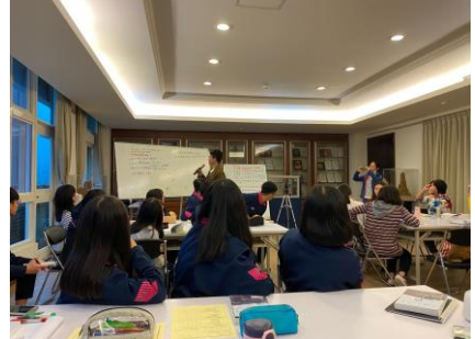
9.現象場·針對白板的提問回饋(講師於社群教室後面)