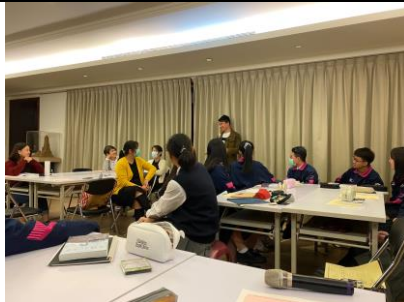
11 現象場·加碼分享個人故事時間(講師於社群教室側邊)