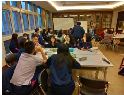
8.小組對話中,思考對講者與書的好奇與疑惑