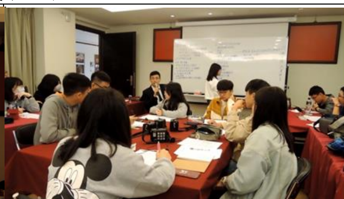
說明：說明教師觀察角度及介入之時機點