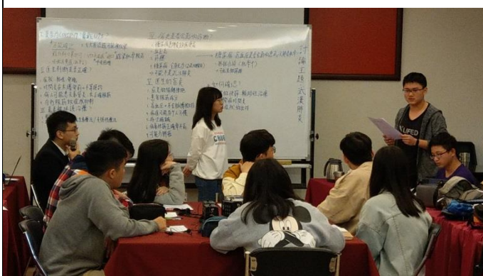
說明：實際 PBL 進行演練